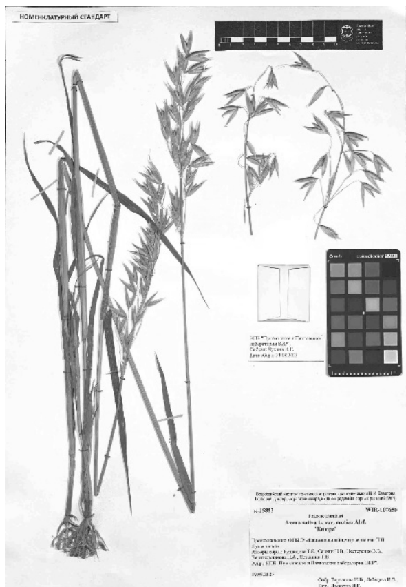
Рис. 5. Номенклатурный стандарт сорта 'Киюра' (WIR-107650)

и переданы на хранение в Гербарий культурных растений мира, их диких родичей и сорных растений (WIR), в Национальный центр генетических ресурсов растений. Ниже приводятся цитаты их этикеток и оцифрованные изображения гербарных листов (рис. 5–6).