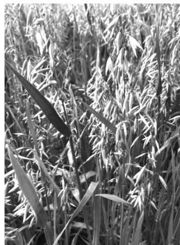
Рис. 3. Растения сорта 'Киюра' в поле НПБ «Пушкинские и Павловские лаборатории ВИР», 19.07.2023

Растение сорта 'Киюра' средней длины-длинное, 120 см. Куст промежуточный. Опушение листовых влагалищ среднее, краев листа ниже флагового отсутствует или очень слабое, верхнего стеблевого узла сильное. Метелка средней длины-длинная, полуодно-сторонняя, с полуприподнятым расположением ветвей. Колоски пониклые. Верхняя колосковая чешуя средняя-длинная, со средним-сильным восковым налетом. Нижняя цветковая чешуя белая, средней длины, со слабым-средним восковым налетом. Тенденция к остистости у первой зерновки очень слабая-слабая (рис. 3).