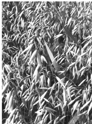
Рис. 4. Растения сорта 'Дебютный' в поле НПБ «Пушкинские и Павловские лаборатории ВИР», 19.07.2023 (WIR-107651)

Овес 'Дебютный' формирует рослые растения высотой 110 см с полупрямостоящим кустом. Листовые влагалища, края листа (ниже флагового) не опушены, либо опушение очень слабое. Верхний стеблевой узел не опушен. Растения образуют соцветия средней длины: метелки двухсторонние, с горизонтальным расположением ветвей, пониклыми колосками. Верхняя колосковая чешуя покрыта восковым налетом (степень выраженности признака от слабого до среднего). Нижняя цветковая чешуя белая, средней длины, со слабым восковым налетом. Тенденция к остистости у первой зерновки средняя. В зависимости от условий возделывания остистость может быть очень слабой (рис. 4).