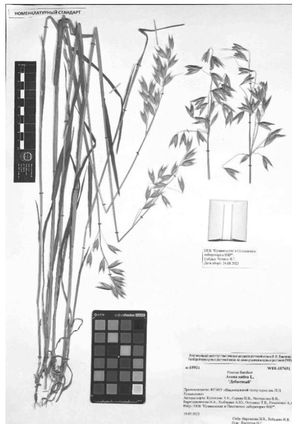
Рис. 6. Номенклатурный стандарт сорта 'Дебютный' (WIR-107651)