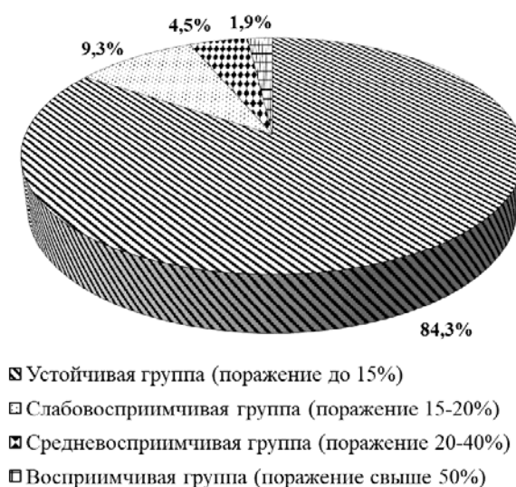
Рис. 2. Распределение селекционного материала озимой твердой пшеницы по

Жесткая браковка материала по устойчивости к возбудителю желтой ржавчины в 2008 году, привлечение устойчивых форм в гибридизацию, целенаправленное изучение полученного нового исходного материала в условиях искусственного заражения патогеном, позволили создать сорта и линии озимой твердой пшеницы, которые в основном характеризовались, как устойчивые и слабовосприимчивые (рис. 2).